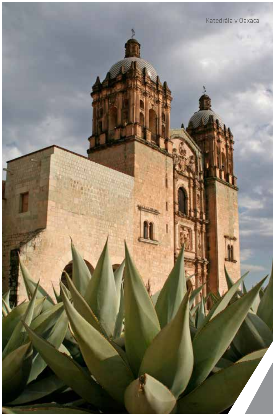
Katedrála v Oaxaca

catán. „Biele mesto“ MÉRIDA - tradičná metropola Mayov.