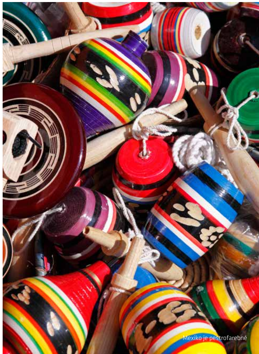
Mexiko je pestrofarebné

používajú miestni na vyhánanie zlých duchov. Vodopád AGUA AZUL v pralesi. PALENQUE – architektonický skvost vrcholnej mayskej civilizácie ukrytý v džungli. Chrám nápisov, Chrám jaguára a Palác grófa. Ochutnali ste už