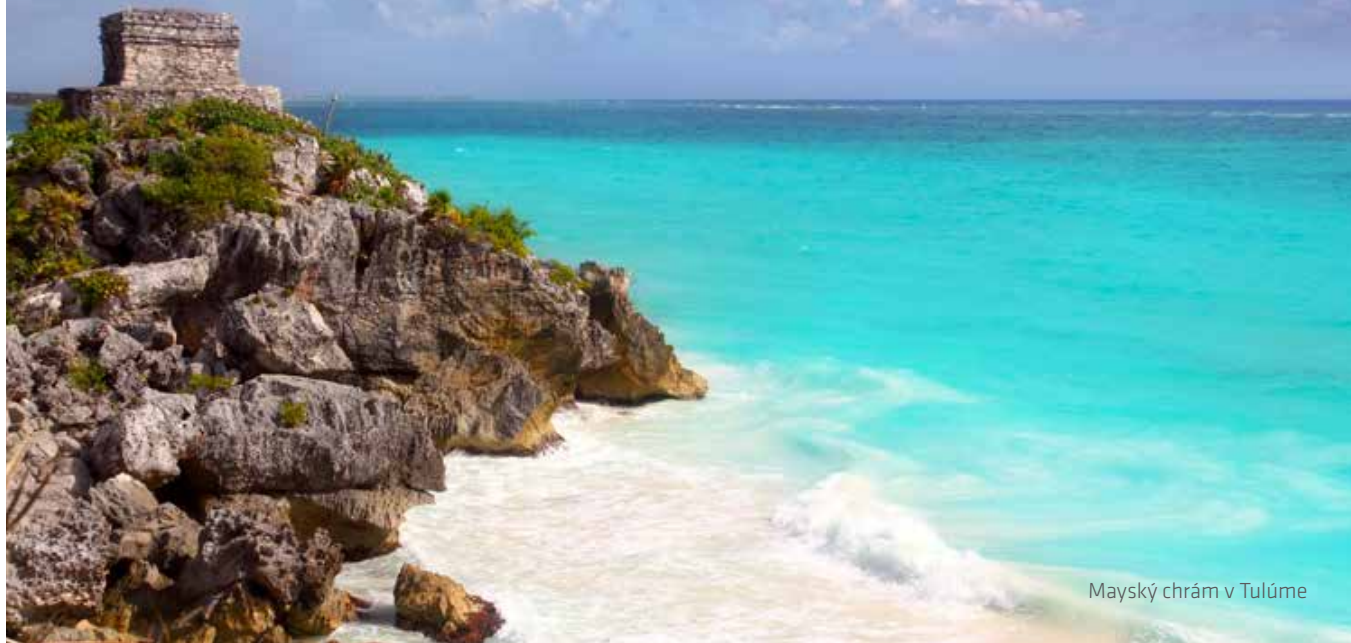
Mayský chrám v Tulúme