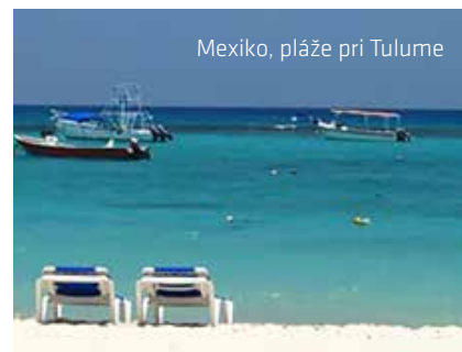
Mexiko, pláže pri Tulum

Uxmal, Chichén Itzá, San Cristóbal de las Casas Exkluzívny zájazd s garanciou NAJlepšieho programu na Slovensku!